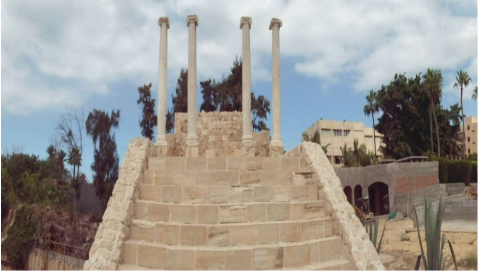
شكل ( 1 ) الجهة الأمامية للمعبد .