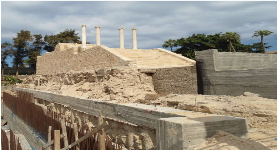
شكل ( ٢ ) المعبد يقف علي مصطبة مرتفعة.